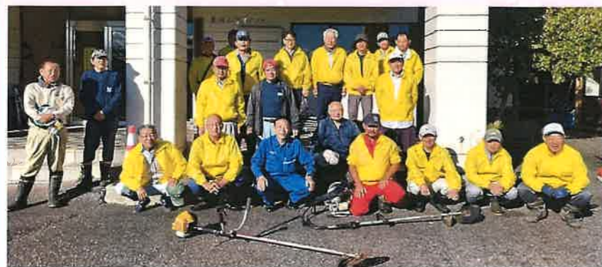
来年の桜が楽しみです！早朝よりお疲れさまでした。