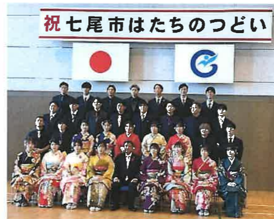
みんなで記念写真撮影