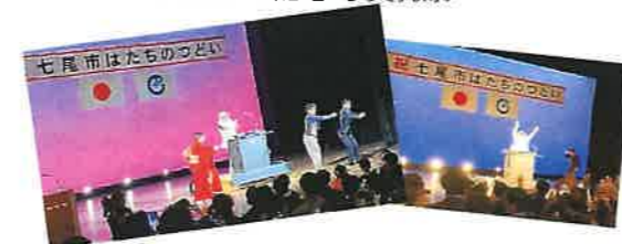
DJKOOさんが登場し、会場は熱気に包まれたそうです。