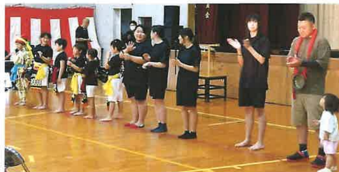
ますまのご長寿を願って パンザイ〜