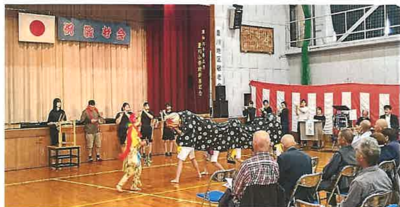
元気な子ども獅子舞でお祝い