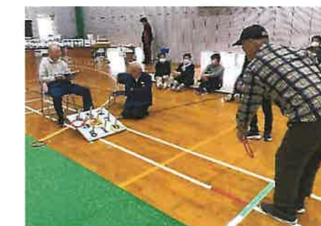
狙いを定めて！それ！