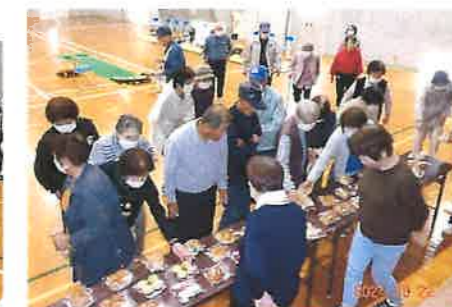
どれにしようかなあ～楽しいパン選び