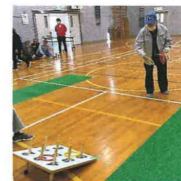
めざせ！パーフェクト！