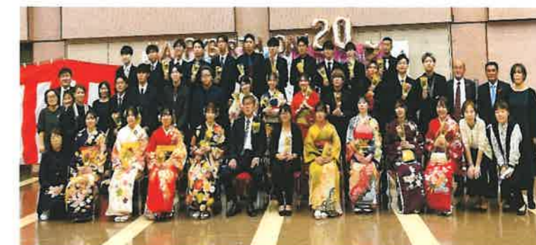
中学校恩師と一緒に！笑顔いっぱい！うれしい再会