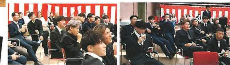
中島小・中学校の思い出のスライドショーを見ながら歓談